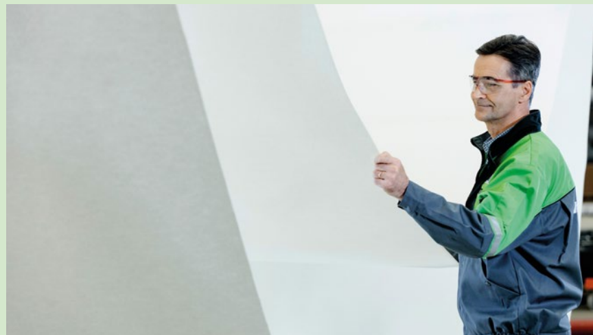
Este é um feltro para prensas da Valmet, portanto, será chamado de Valmet Press Felts .