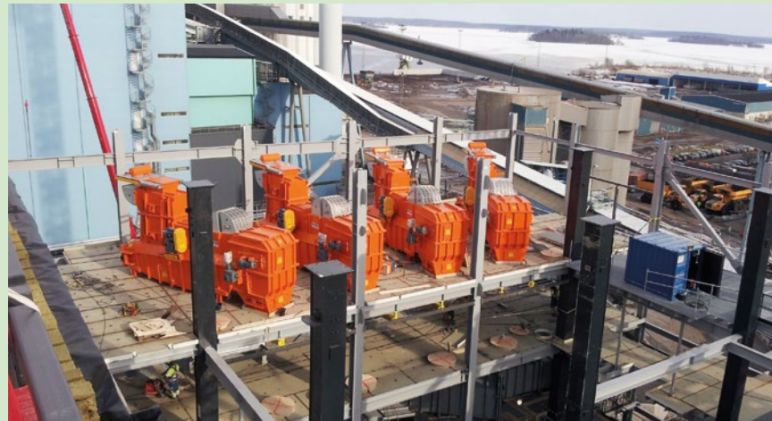
Este é um alimentador de combustível residual da Valmet, portanto, será chamado de Valmet Waste Fuel Feeder .